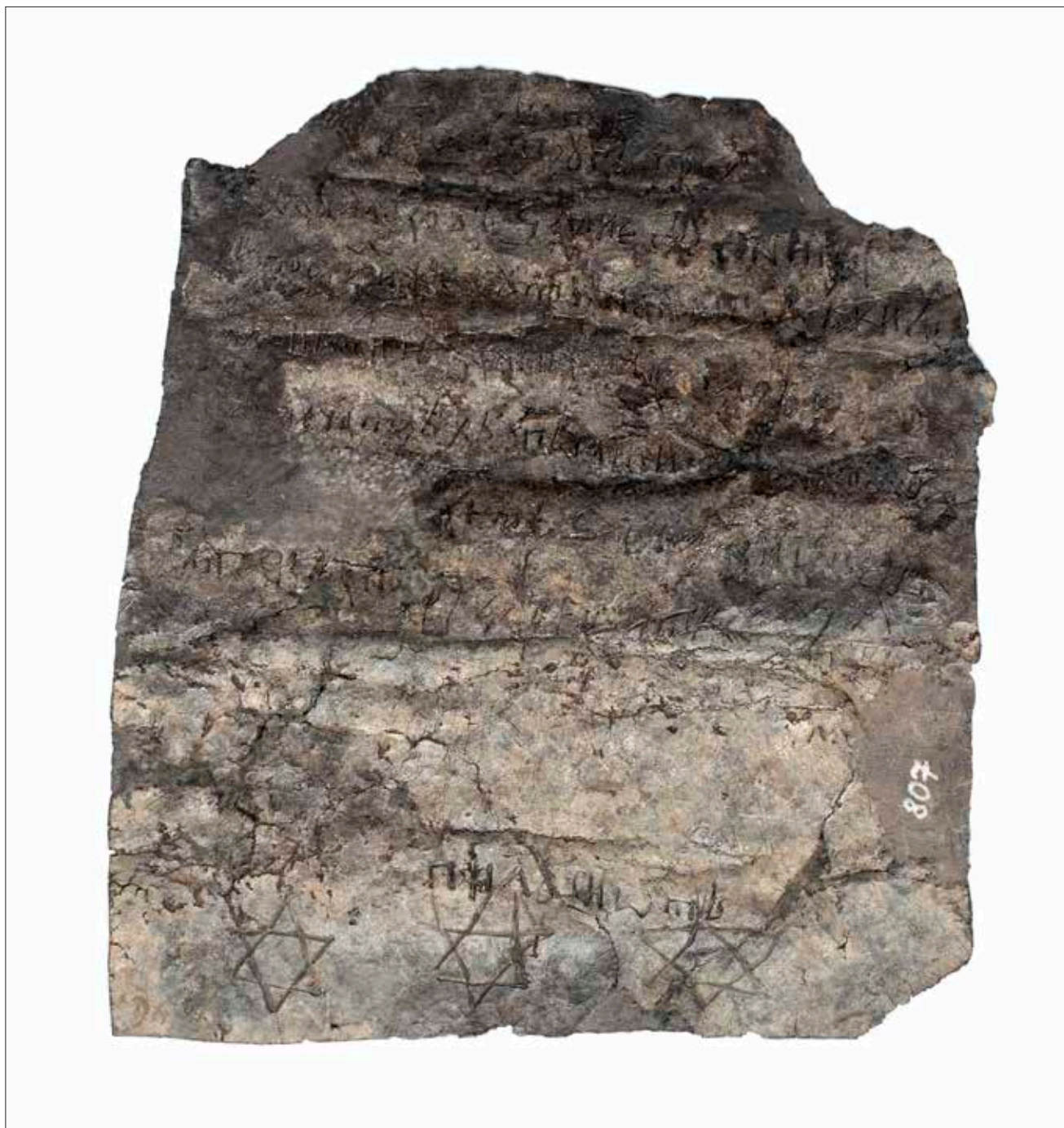
Sl. 2. Druga strana pločice